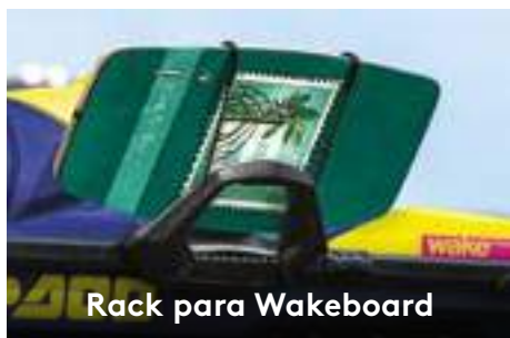
Rack para Wakeboard

Um ponto ideal de reboque e se retrai quando não estiver em uso. Possui manoplas de apoio para o vigia e espaço de armazenagem para a corda.