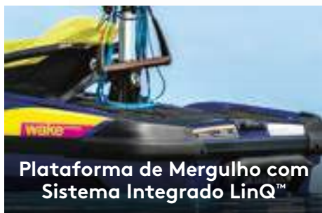
Plataforma de Mergulho com Sistema Integrado LinQ™

Exclusivo sistema de engate rápido integrado à maior plataforma de mergulho do mercado, que facilita a instalação de acessórios. 1