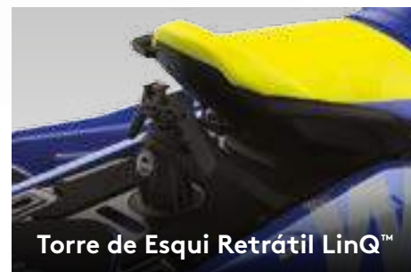
Torre de Esqui Retrátil LinQ™

O primeiro sistema de áudio Bluetooth® original de fábrica, verdadeiramente à prova de água. 2